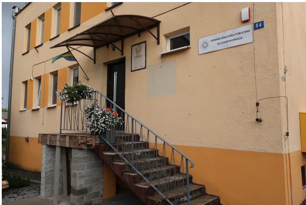
Wejście do Gminnej Biblioteki Publicznej w Charzykowach

Gminna Biblioteka Publiczna w Charzykowach to instytucja podlegająca od 2016 roku pod Gminny Ośrodek Kultury w Chojnicach. Przez pierwsze dwa lata działania w ramach struktur GOK Chojnice, Biblioteka mieściła się w Szkole Podstawowej w Charzykowach. W 2018 roku placówkę przeniesiono do specjalnie wyremontowanego i zaadaptowanego budynku po dawnym ośrodku zdrowia, w którym Biblioteka działa do dziś. Co istotne, obecnie Biblioteka jest jedyną gminną placówką biblioteczną na terenie gminy wiejskiej Chojnice należącej – pod względem powierzchni – do największych gmin w Polsce.