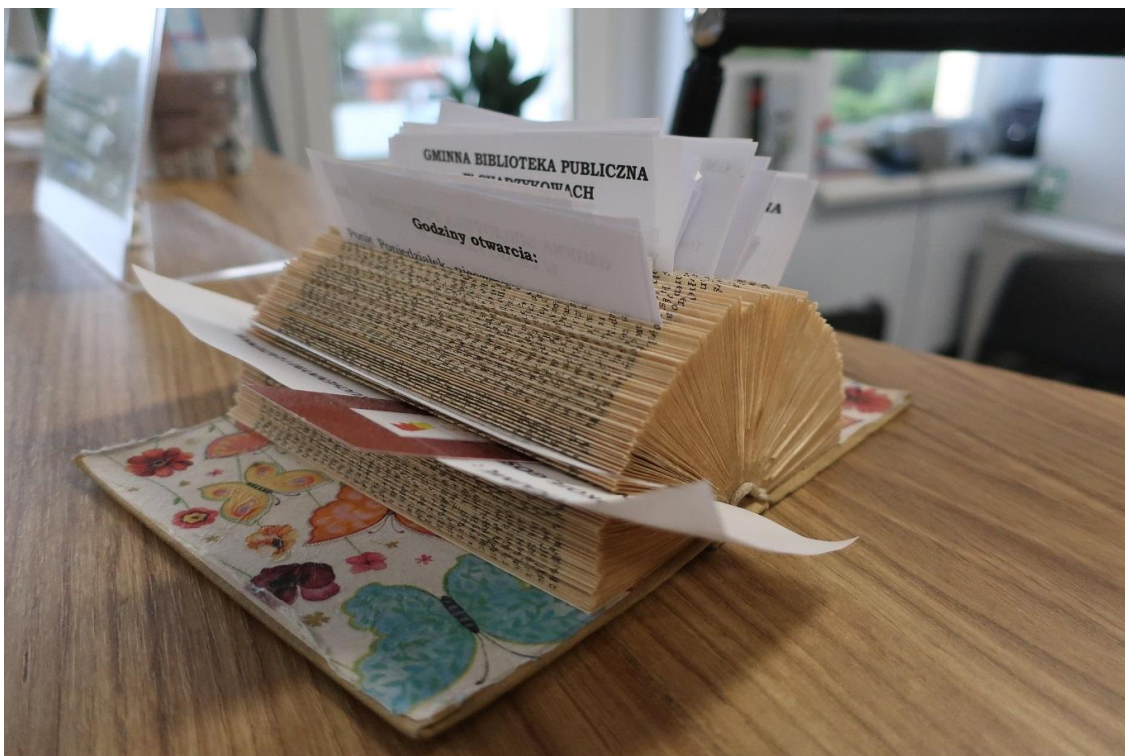
Dekoracje zrobione z książek w Gminnej Bibliotece Publicznej w Charzykowach

Nie bez znaczenia jest również odległość od szkoły, jeziora oraz bliskość sklepów spożywczych (w tym znanego sklepu mięsnego) – młodzi bardzo cenią sobie centralną lokalizację Biblioteki. Uczniowie jako atut biblioteki wymieniali również to, że jest ona w Charzykowach, że ma według części uczniów bogaty i ciekawy księgozbiór młodzieżowy: Można znaleźć książkę dla siebie . Młodzież pozytywnie oceniła sposób prezentacji książek ( ładnie poukładane książki ) oraz, że można dostać darmowe zakładki. Zdarzyło się jednak kilka osób, które nigdy nie były w bibliotece i nie miały o niej wyrobionego zdania.