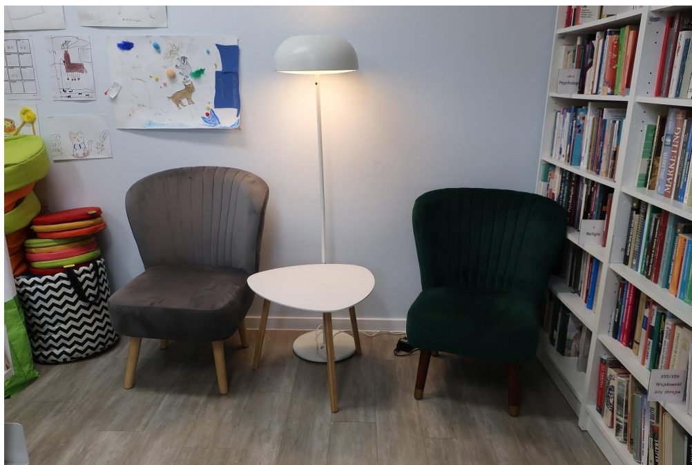
Miejsce do siedzenia w Gminnej Bibliotece Publicznej w Charzykowach

Drugi problem księgozbioru i oferty Biblioteki dotyczy starszych senierek i seniorów. Osób, które być może są już mniej mobilne, mają trudności z czytaniem, niechętnie wychodzą z domu. Te osoby często spędzają czas same, nie wiedząc, że Biblioteka mogłaby im coś zaoferować. Odpowiedzią byłyby na przykład książki z większymi literami dla osób słabiej widzących albo audiobooki na czytnikach dostarczane bezpośrednio do domu seniora.