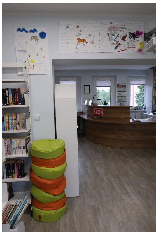
Wnętrze Gminnej Biblioteki Publicznej w Charzykowiec