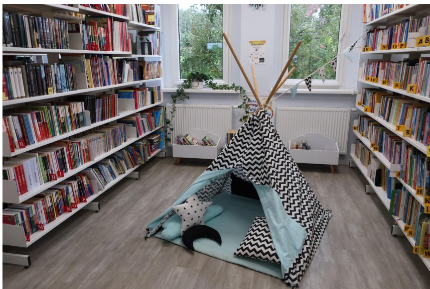
Kącik dla malucha w Gminnej Bibliotece Publicznej w Charzykowach