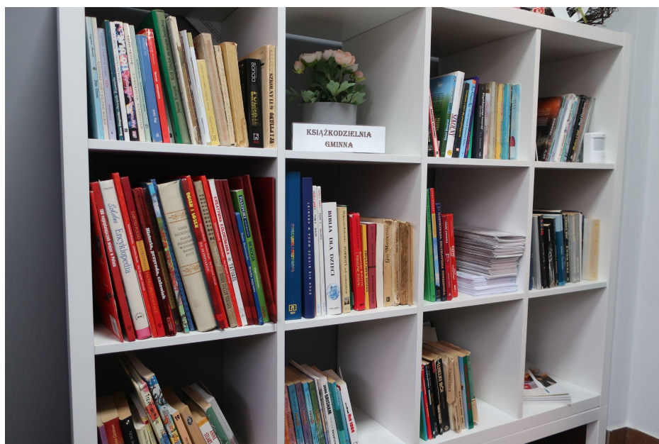
Książkodzielnia w Wiejskim Domu Kultury w Ogorzelinach

W domu kultury w Ogorzelinach w przedsionku przy wejściu jest książkodzielnia, czyli regał z książkami, które można wypożyczać i wymieniać do czytania. Po części są to książki przekazane z biblioteki w Charzykowach, po części od mieszkańców.