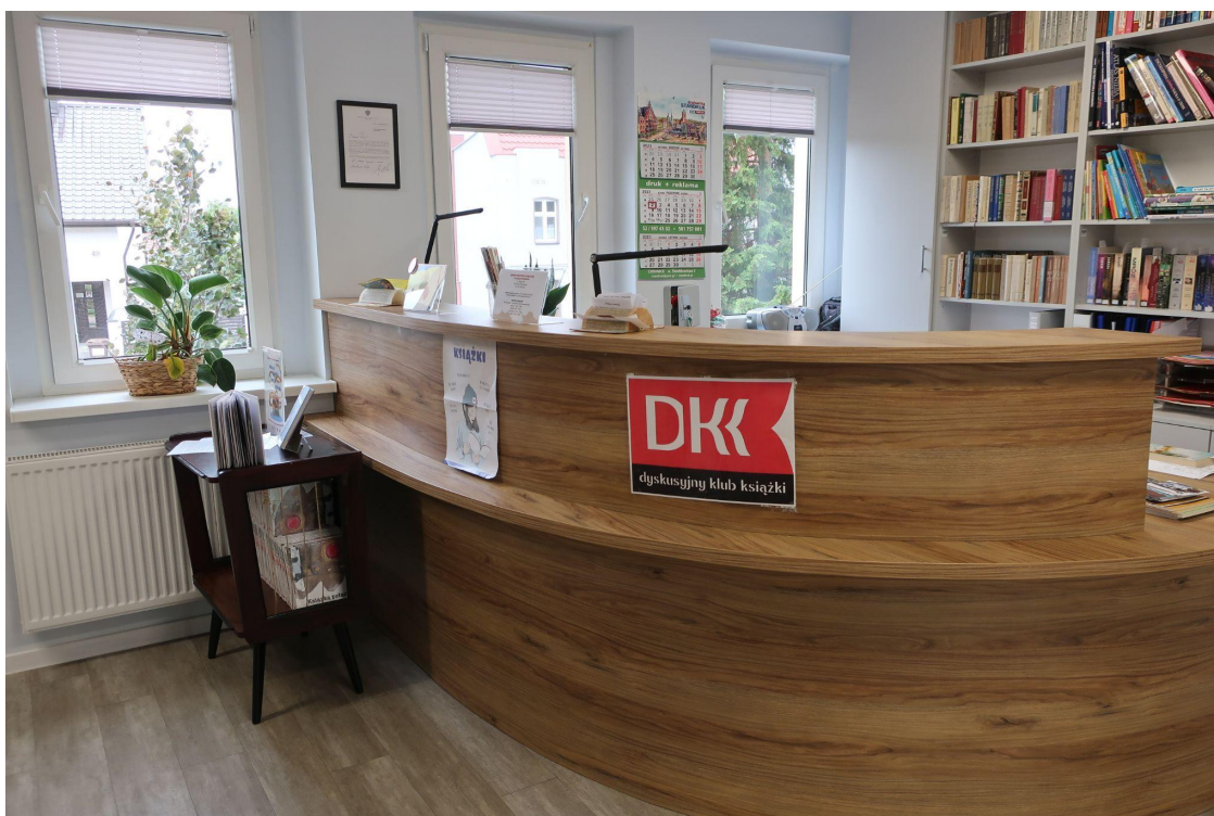
Rejestracja i wypożyczalnia w Gminnej Bibliotece Publicznej w Charzykowach

Wiele użytkowniczek Biblioteki podkreślało właśnie ten problem. Zdarzało się, że same – choć są aktywnymi uczestniczkami zajęć – nie mogły wziąć udziału w wielu warsztatach właśnie ze względu na brak miejsc. Albo chciały przekazać informację o spotkaniu znajomym, zachęcić ich do przychodzenia do Biblioteki, ale wiedziały, że jeśli Biblioteka odmówi udziału, to nowa osoba może się zniechęcić i nie przyjść już więcej do placówki.