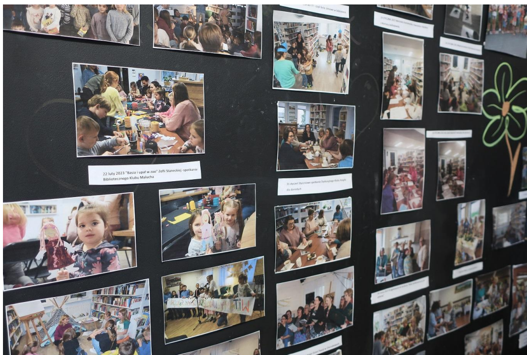
Tablica pamiątkowa dokumentująca spotkania i warsztaty biblioteczne

Nasza Biblioteka, poza oczywistą działalnością wypożyczenia książek, prowadzi liczne zajęcia, przede wszystkim Dyskusyjny Klub Książki dla dorosłych. Klub Książki działa od kilku lat i zrzesza coraz więcej osób. Ja prowadzę Biblioteczny Klub Malucha, to są spotkania dla najmłodszych czytelników wraz z ich opiekunami, gdzie taką rolą główną jest książka, ale oczywiście przy okazji bawimy się i są to najróżniejsze zajęcia ogólnorozwojowe. Działamy w wakacje i w ferie, przygotowujemy liczne zajęcia dla dzieci, od gier terenowych po kaligrafię, po różne gry rozwojowe, lekcje geografii, naprawdę bardzo różnorodne. Poza tym uczestniczymy we wszystkich świątach bibliotecznych, w Tygodniu Bibliotek, w Dniu Głośnego Czytania, w Dniu Postaci z Bajek, oczywiście w Narodowym Czytaniu. Są to takie nasze punkty, gdzie zawsze staramy się coś przygotować, czy to spotkania autorskie czy warsztaty.