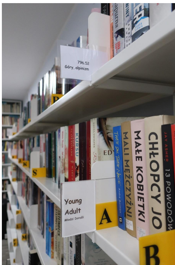
Dział młodzieżowy w Gminnej Bibliotece Publicznej w Charzykowach

specjalnych krzeseł komputerowych. Z dodatków młodzież chciałaby, aby w Bibliotece był dostęp do lodówek-automatów z piciem i przekąskami. Ciekawe odpowiedzi dotyczyły również wyglądu zewnętrznego budynku biblioteki. Dla wielu osób nie jest ona zachęcająca oraz nie rzuca się w oczy, jeśli ktoś nie wie, że w budynku mieści się biblioteka. Pomysł, jaki zaproponowała młodzież, to umieszczenie wielkiego napisu „biblioteka” na górze budynku lub na ścianie, aby był on dobrze widoczny z daleka.