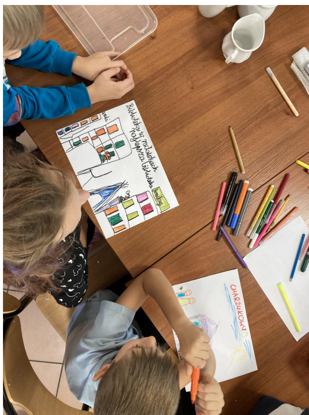
Praca podczas warsztatu badawczego w Świetlicy Wiejskiej w Raclawkach

Wszystkie osoby biorące udział w warsztatach badawczych знаły bibliotekę w Charzykowach – większość z nich odwiedziła Bibliotekę dzięki uczestnictwu w wycieczce dzieci i młodzieży ze świetlicy w Raclawkach do Biblioteki w Charzykowach. Przy okazji wyjazdu dzieci poznały Bibliotekę, wypożyczyły książki, wzięły udział w zajęciach warsztatowych związanych z wybraną lekturą, spędziły także czas w samych Charzykowach. W samej Bibliotece w Charzykowach dzieciom podobał się duży wybór książek, w tym dostępność fantastyki, a także szeroka oferta publikacji dla najmłodszych dzieci. Osoby biorące udział w warsztacie zwracały uwagę na przytulny wystrój Biblioteki i aranżację, dzięki której można usiąść z książką na fotelu, na krześle czy pufach, a nawet schować się w tipi. Z uwagi na dystans i niemożność osobistego zwrotu wypożyczonych pozycji, książki do Biblioteki przekazała instruktorka świetlicy.