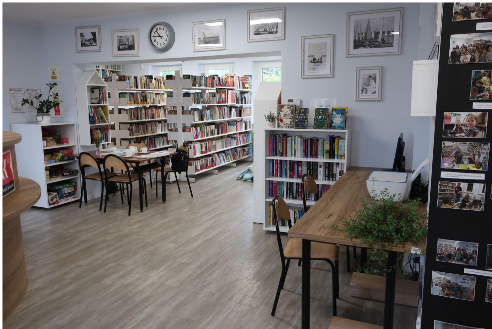
Wnętrze Gminnej Biblioteki Publicznej w Charzykowiec